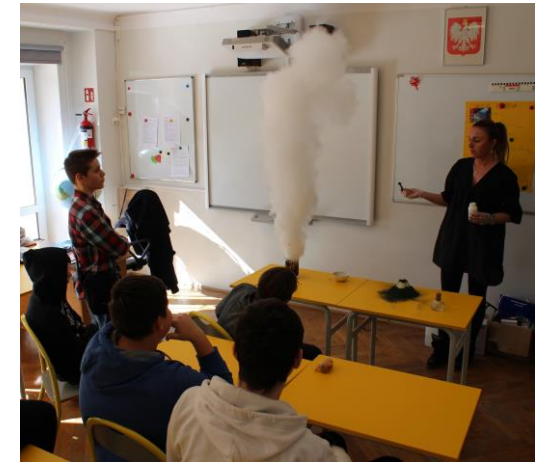
Doświadczenia w pracowni chemicznej

Nauczycielami Szkoły są wykwalifikowani pedagodzy z wieloletnim doświadczeniem w pracy z, wymagającą specjalnych metod nauczania, młodzieżą. Wszyscy są absolwentami pedagogiki resocjalizacyjnej. Szkoła oferuje również specjalistyczną pomoc psychologa, logopedy, terapeuty pedagogicznego, pedagoga. Cechy wyróżniające naszych nauczycieli to: otwartość, serdeczność, empatia i poczucie humoru.