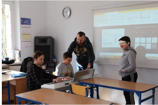
Lekcja muzyki w pracowni artystycznej